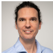
C.F. Müller Verlag Sven Hübler